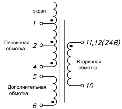
Схема электрическая принципиальная